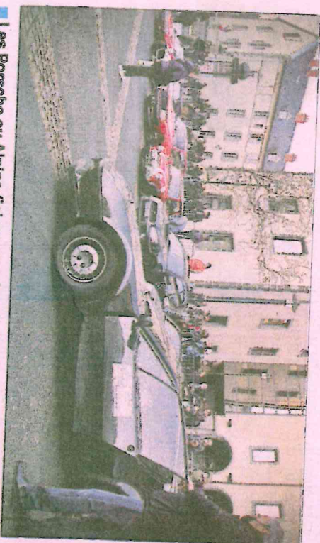
■ Les Porsche ou Alpine (ici au premier plan) côtoyaient des véhicules plus ou moins sportifs comme des Austin Mini Cooper, des Subaru... ou beaucoup moins, comme une DS, une 4L et même une 2 CV !